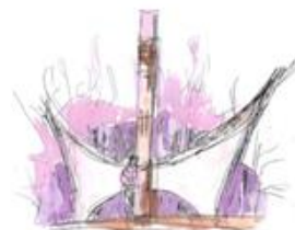
Zespół Szkół Ponadgimnazjalnych w Chojnie